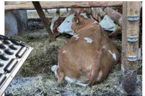
POLSTA ist im vorderen Bereich der Tiefbox montiert