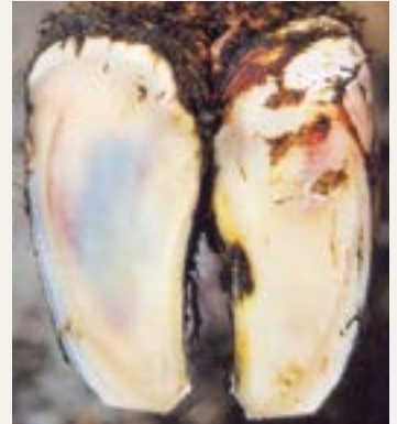
Des colorations bleuâtres, jaunâtres et rougeâtres sont des signes typiques de la fourbure subclinique.